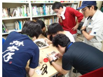
教員も協力して調べます