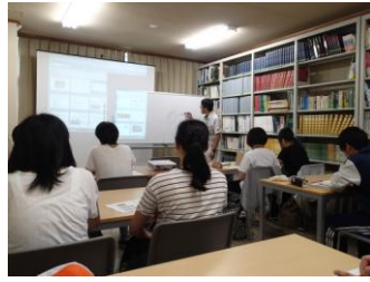
トキ交流会館にて講義 「トキ野生復帰と自然再生」