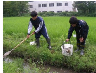
実験田での生物採集