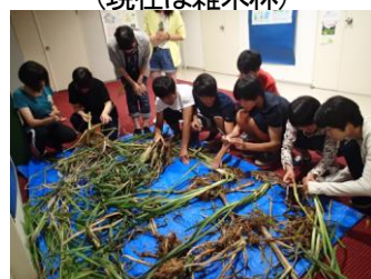
採取したガマやヨシ