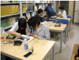
水生生物の同定作業