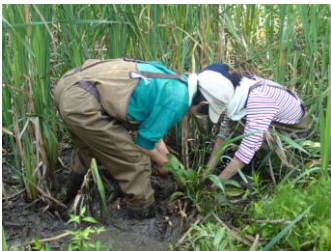
ガマの地下茎を 掘り採ります