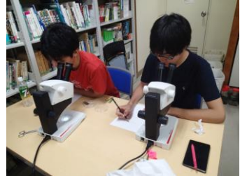
ガマやヨシの葉や 地下茎をスケッチ