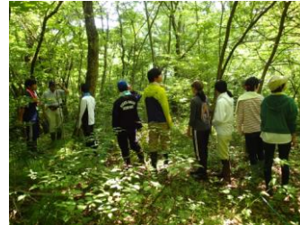
キセン城の旧棚田 (現在は雑木林)