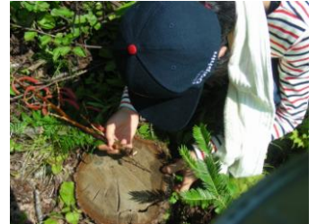
コナラの樹齢調査