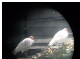
トキの森公園のトキ