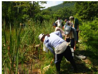
キセン城棚田での 生物採集