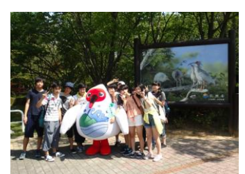
トッキッキにも 会えました