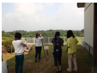
野生のトキを観察 (8羽確認)