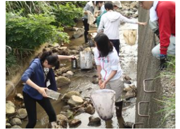
川で泥の洗い流し