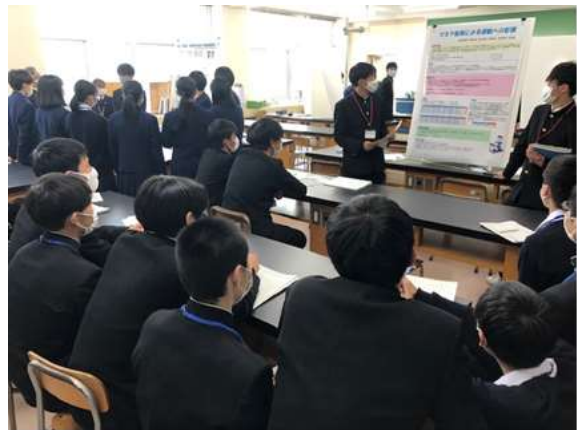
(ポスター発表の様子)

ポスターセッション（5限）は、研究班の一人一人が、研究の全体を把握し、主体的に研究を進めていくことを期待し、一般的な学会と同じように、各研究班（3～4名）の誰かが常にポスター前にいて発表する形で行いました。2年生は他班の研究手法を参考に、1年生は来年度の研究テーマ設定にむけて、活発な質疑応答が交わされました。